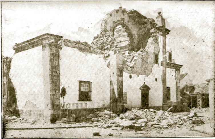
Figura 2: Efeitos do sismo de 23 de Abril de 1909 em Benavente (MIRANDA 1931a).

“Desde as 13h-55m,4 deste dia o pêndulo mostrou-se inquieto até às 17h-40m,1, hora a que executou uma oscillação, partindo de E. para W., com a amplitude de 2mm,40 (0",62). Seguidamente registou-se uma serie de oscillações, 7 das quaes de amplitude superior a 17mm,00 (4",42), produzindo o deslocamento da posição d'equilibrio A amplitude das oscillações diminuiu gradualmente até atingir 0mm,70 (0",18) às 18h-10m,3, em que voltou a augmentar, partindo do pêndulo de W. para E., e attingindo o valor de 1mm,40 (0",36). Tornou a diminuir e parou, ás 18h-55m,4. Tremor domesticus . Epicentro em Benavente. Sentido em Coimbra com a força VI (Forel-Mercalli)” (Observações Meteorológicas, Magnéticas e Sísmicas, 1910).