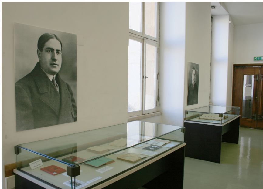
Fotografia da exposição sobre Mário de Sá-Carneiro na Sala do Catálogo.