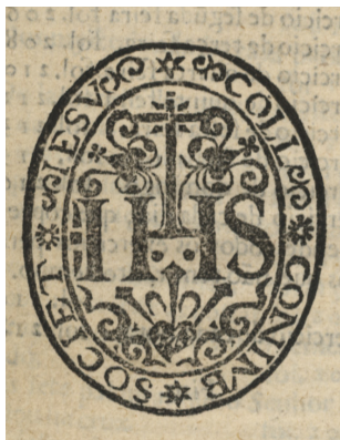
Emblema da Companhia de Jesus retirado da obra “Compendio spiritual da vida christam”.

– Exposição Conimbriga Urbe ad Orbem , de 7 julho a 30 outubro, lembrando alguns dos milhares de Irmãos e Padres que, formados ou apenas tendo passado por Coimbra, se espalharam por todo o mundo. O Catálogo da exposição bibliográfica encontra-se em Anexo.