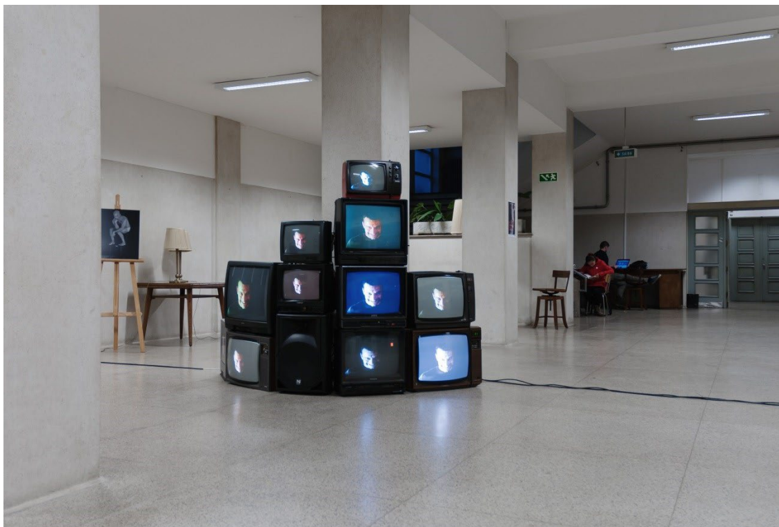
Suspension of Disbelief. Vídeo-instalação. 2013.

Actualmente coordena a Décollage – Conteúdos e Instalações Audiovisuais,