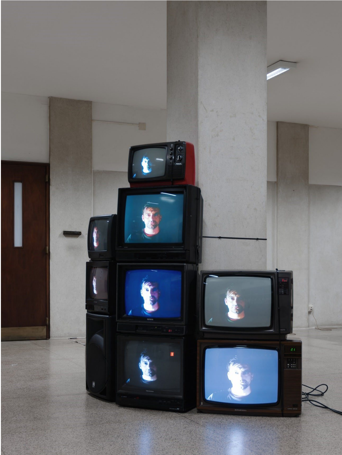
Suspension of Disbelief . Vídeo-instalação. 2013.