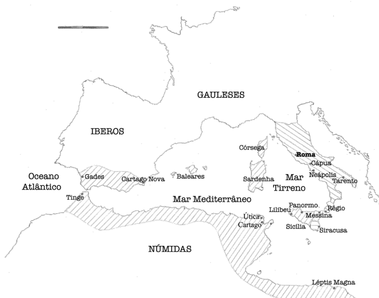
Fig. 1. Guerras Púnicas - por Fábio Mordomo

romana – gerando cidades aliadas, que perdiam independência política, mas que obtinham grandes benefícios e que continuavam a poder gerir os seus assuntos internos. Até inícios do séc. III a. C., a expansão romana conheceu um ímpeto assinalável, devido também à submissão das colônias gregas da Itália peninsular. Os recursos humanos da República e a capacidade integradora de Roma potenciavam um crescimento assinalável da escala da guerra e pareciam anunciar que, em breve, a cidade deixaria de ser uma potência meramente peninsular. O conflito com Cartago tornava-se iminente, e nada mais lógico do que ser a ilha da Sicília – situada entre as duas potências rivais e um território estratégico para o controlo do comércio mediterrâneo – a constituir o palco dos primeiros confrontos.