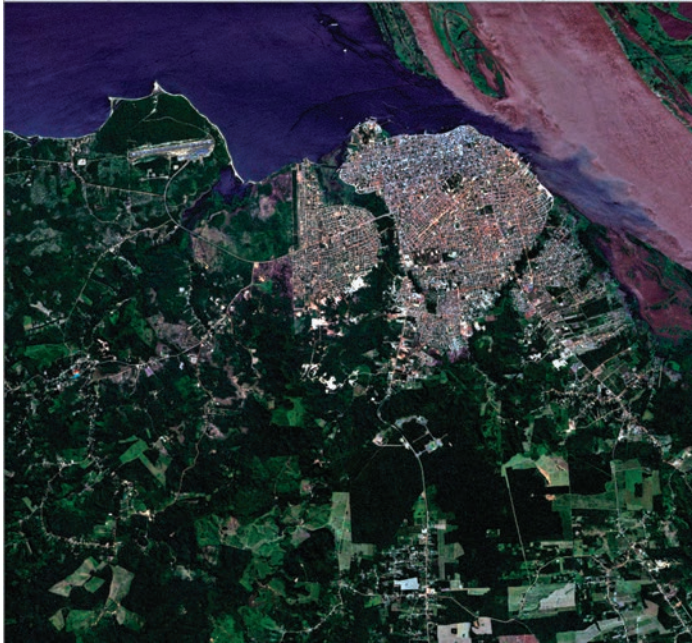
Figura 1 - Composição colorida usando as bandas do visível (RGB) da imagem Rapid Eye 2137925_2011-07-30_RE3_3A_166642 utilizada no estudo (com realce de brilho em editor de imagem)