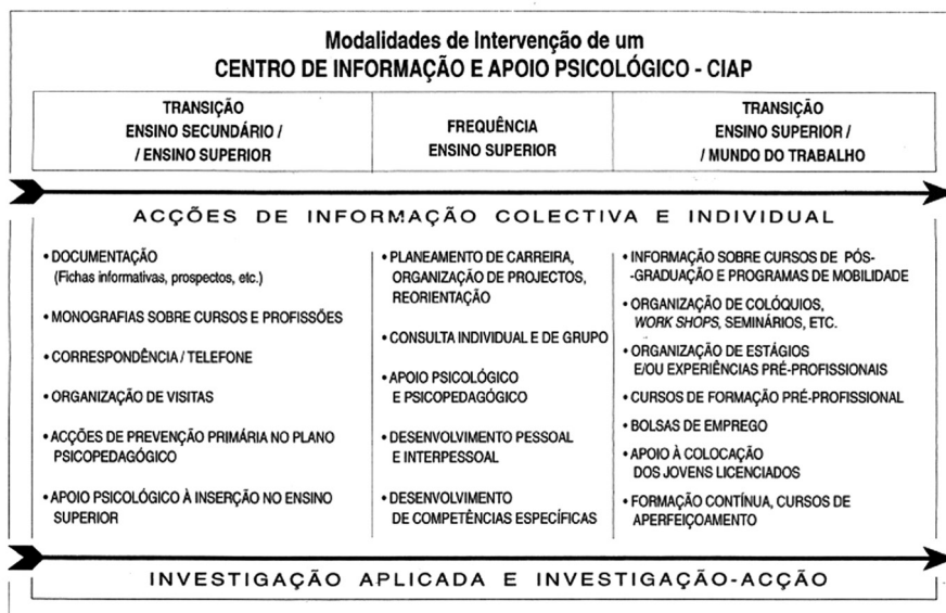
Figura 1. Modelo de funcionamento dos Centros de Informação e Apoio Psicológico (C.I.A.P.)

Finalmente, no plano da transição para o mundo do trabalho preconizam-se acções de informação sobre cursos de pós-graduação e programas de mobilidade internacional, a organização de colóquios, workshops e seminários sobre temas ligados às necessidades identificadas por representantes do mundo do trabalho, o desenvolvimento de programas de formação em competências de procura de emprego e de prospecção estratégica do mercado de trabalho que pode englobar a criação do auto-emprego, a organização de estágios e /ou experiências pré-profissionais, a realização de cursos de formação pré-profissional, a criação de bolsas de emprego e/ou unidades de inserção na vida activa, actividades de formação contínua, cursos de aperfeiçoamento, entre outros (cf. fig. 1).